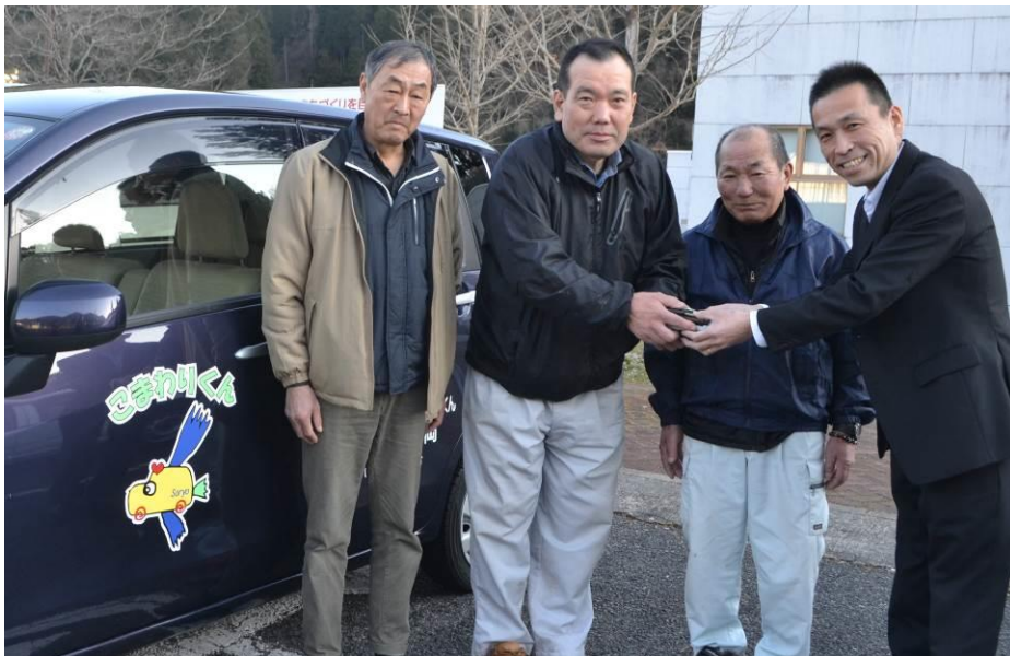
平成 29 年 2 月 28 日 「こまわりくん」の事業が社会福祉協議から一般社団法人庄原市総領自治振興区に引き継がれました。