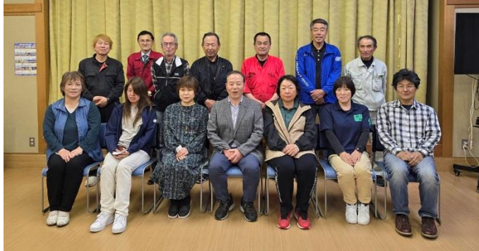
新年度第1回目の役員会にて

令和6・7年度の区長、副区長、役員、各部の部長、副部長、部員が決定しました。これから2年間よろしくお願ひします。