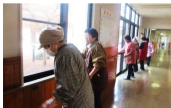
張り切って愛善苑の窓ふき！

はっぴいメイトは、総合的な女性の健康づくりを目指し、ボランティアや研修、地域イベント事業に出掛けるなどの活動をしています。今年度も、女性の健康作りや食育の研修会に参加し、愛善苑の配食や年末大掃除、高齢者の見守りなどボランティア活動にも取り組んできました。また、夏祭りや歳末たすけあい芸能大会などのイベントにも進んで参加、デイホームからもお声を頂き、地域の皆さんとの交流を積極的に図ってきました。元気な町づくりの一端を担っていきたくと一緒に活動できる仲間を募っています。（問い合わせ先：しあわせ館）