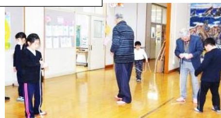
こま回しコーナー