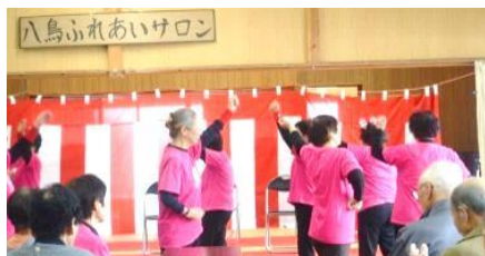
八鳥デイホームで、舞台上に立つ！