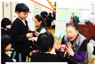
あやとりコーナー