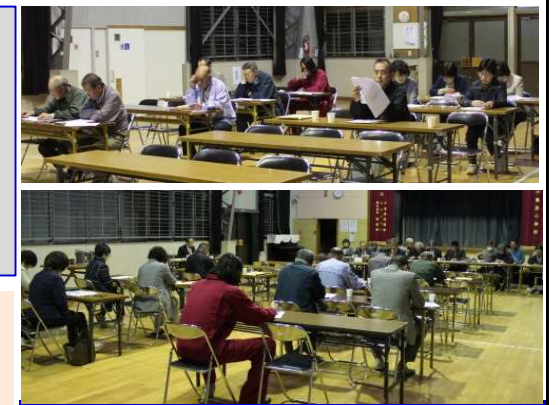
出席された総代のみなさん

第7回定時総代会 出席状況 ・全総代数 38名 ・出席総代数 30名 (内、委任状 16名)