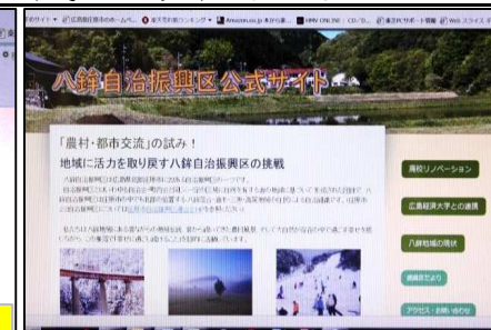
本画面にかわりますので、八銚自治振興区の活動状況をご確認ください

兼ねてより取り組んで参りました「公式サイト」が完成しました。『八銚自治振興区』と入力して検索、画面が変わると『八銚自治振興区』出ますのでクリックして入ってください。現在十分な情報は入っていませんが、今後整備し情報を発信して参ります。