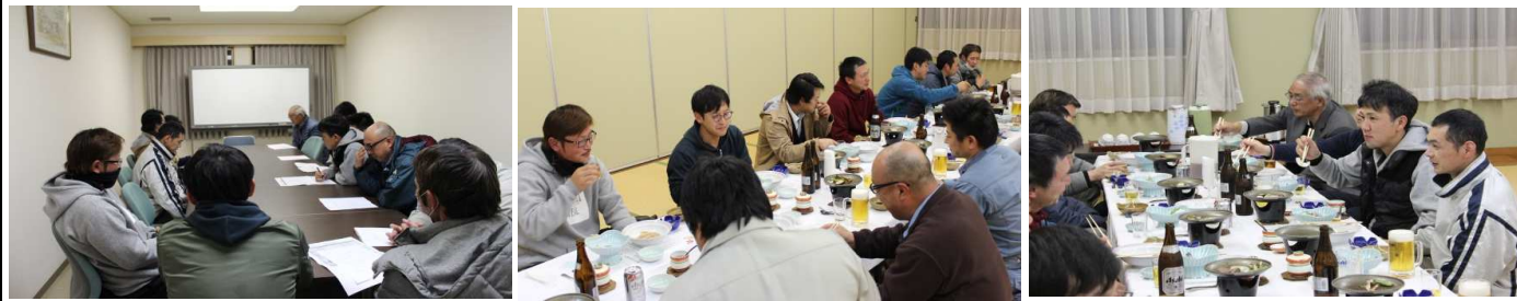
定木会長より、地域の現状、将来に期待するものについて講

振興区内の人口が500名を割り、過疎・高齢化が一層深刻となっており、15名参加のもと地域の現状・将来に向け、定木会長を講師に招き勉強会を開催しました。終了後は、席を移動し情報交換会を行い懇親を深め、大変有意義な会となりました。