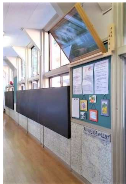
1階、廊下の掲示用黒色ボード