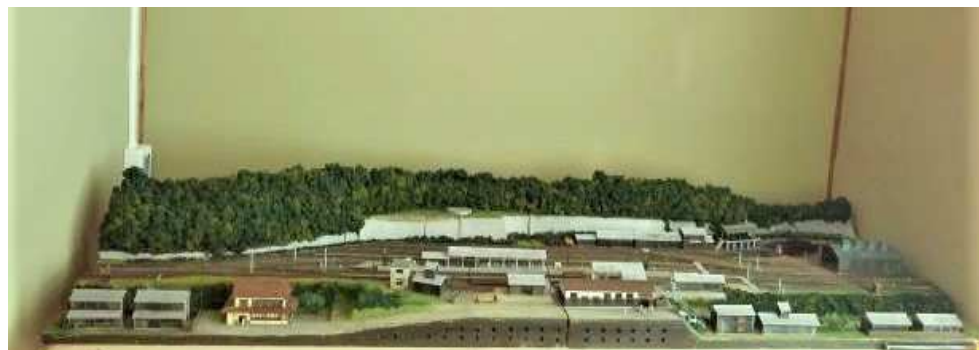
備後落合駅のジオラマ 昭和45年当時 縮尺150分の1(2階⑤)