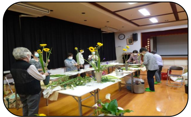
カトリア会の様子 ヒマワリ、オクラレルカ、トルコギキョウなどを使って