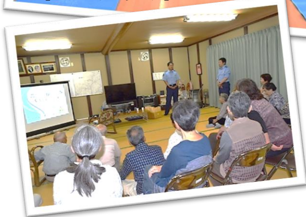
【東城交番による防犯指導】

◆午前のプログラムが終わると、参加者の皆さんが一番楽しみにされている昼食です。ボランティアで参加してくださっている女性の皆さんの手料理に感謝しながら美味しくいただきます。