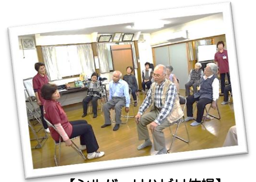
【シルバーリハビリ体操】

◆「元気な早いうちから、自分の体を気にかけて自分でケアできるようにすることが、健康寿命につながる」というコンセプトのもと、様々な分野の講師の先生にご協力いただき、今年度もデイホームが始まりました。