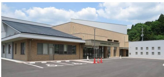
左手前：事務局 右奥の白い棟：庄原市立図書館東城分館

完成した自治振興センターは、住民の地域づくり活動や生涯学習活動・芸術文化活動の推進を目的に「自治振興センター」「東城文化ホール」「庄原市立図書館・東城分館」として3つの機能を持つ複合施設として整備されました。