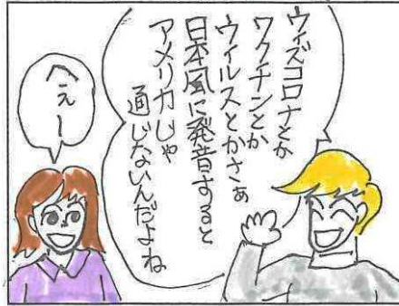
With Corona あるある その2