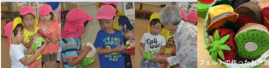
フェルトで作ったお弁当

毎週火曜日に活動している手芸部では、5月からフェルトのお弁当箱を作ってきました。7月2日（火）には、総領保育所の年長さん8名にプレゼントしました。細かい作業に苦戦しながら工夫を重ね10セットをつくりあげました。みんなで案を出し合い、細部までこだわり、安全に配慮し、安心して遊んでもらえるように工夫しました。プレゼントを受け取った子どもたちの笑顔を見た瞬間「作ってよかったー」と心から喜ぶ皆さんの笑顔が素敵でした。手芸部では今後も趣味を生かして楽しめる“場づくり”“時間づくり”を続けていきたいです。興味のある方は、お気軽にご参加ください。