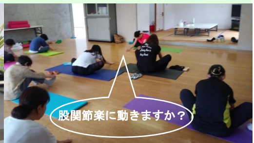
股関節楽に動きますか？