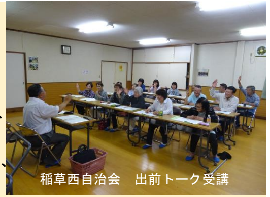
稲草西自治会 出前トーク受講

この「いきかたノート」の特徴は、まだ、元気なうちから、人生のゴールまでの時間を自分らしく豊かなものにしていくための生き方、最後の瞬間を少しでも自分の望みに近い形で迎えるための「逝き方」を考えるノートとして作られています。もう一つの特徴は、自分自身が考えて記すためだけでなく、家族や身近な人と、自分の思いを共有するためのノートだということです。この「いきかたノート」は庄原市が実施する「出前トーク」で説明を受けてもらうことができます。