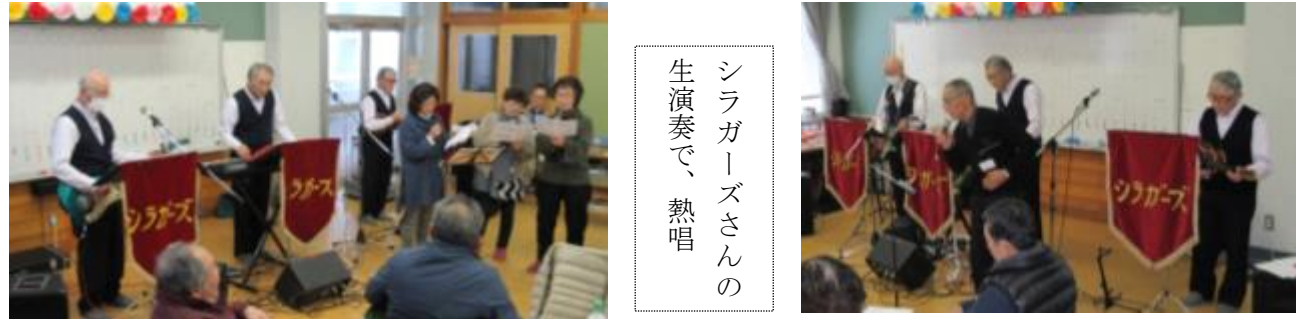
シラガーズさんの 生演奏で、 熱唱

区長の乾杯から始まり、会食、歓談の後、シラガーズさんの生演奏で熱唱。輪投げやビンゴゲームなどして、親睦を深め楽しいひと時を過ごしました。