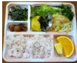
（上記の様なお弁当を作ります）

本村地区社会福祉協議会では、ふれあい給食の調理ボランティアさんを募集しています。 毎月第2・第4水曜日（基本）の午前8時半～12時半頃までです。 ひと班で年に4回、4人で、お弁当作りをさせて頂きます。 調理ボランティアご希望の方は、振興センターへご連絡ください。 詳しくは、本村自治振興センターにお問い合わせください。 （電話 78-2743）