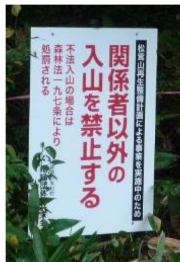
(立て看板を設置しています)