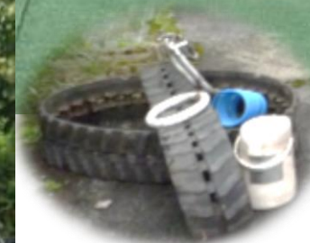
（こんなものまで捨てられていました）