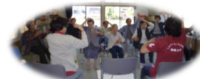
(シルバーリハビリ体操)