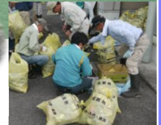
（振興センターへ帰って、仕分けして袋詰めしました）