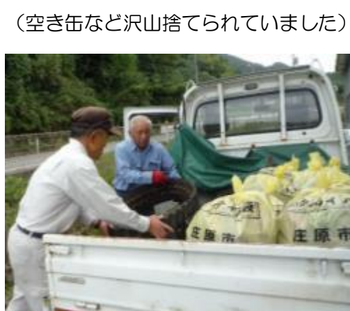
（公衆衛生の役員の方がクリーンセンターへ）