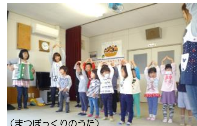
(まつぼっくりのうた)