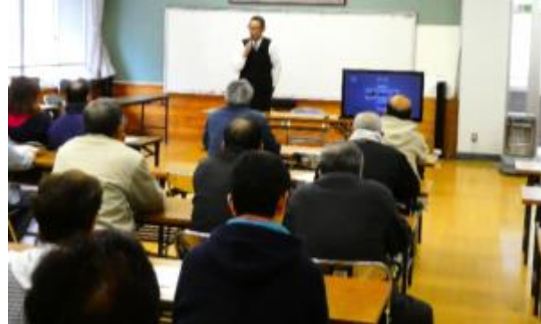
(危機管理課片岡氏の講演)