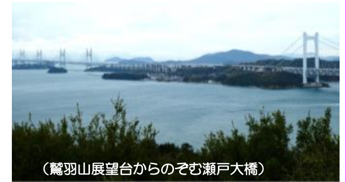
(鷲羽山展望台からのぞむ瀬戸大橋)