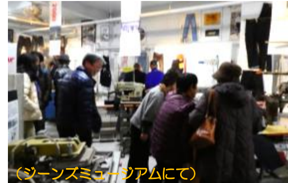
(ジーンズミュージアムにて)