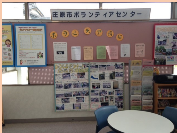
↑ふれあいセンター内にあるボランティア情報コーナー

「ボランティアしてみたいな」「ちょっと手伝ってほしいんだけど…」 そのようなボランティア活動に関する相談をお聞きして、ボランティアの紹介や活動の調整をしたり、研修や講座などを行ったりしています。