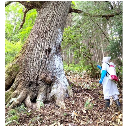
幹の白いところは薬剤が付着