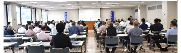
東城支所での記念式典