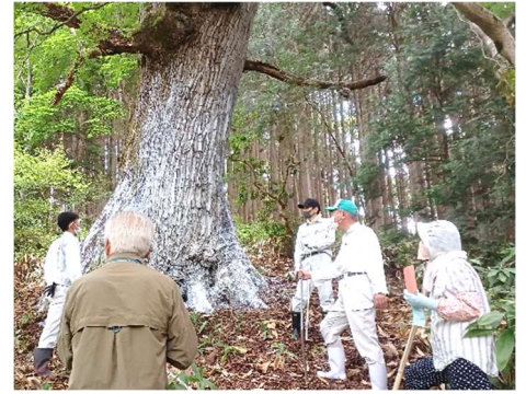
コナラの大木を見上げる皆さん

散布のために上下の雨具、長袖の手袋、防塵マスクを身に付け、薬剤の入った散布機を背負うと、動物の着ぐるみを着たようで体中汗まみれになるくらい暑かったです。