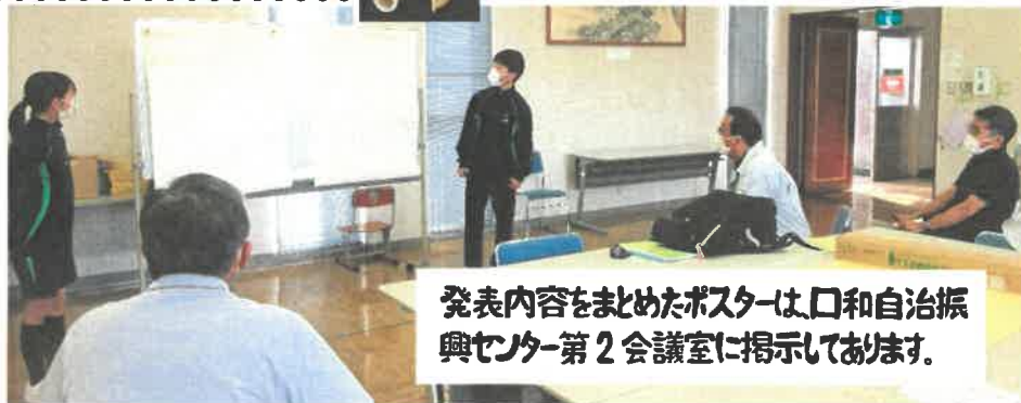
発表内容をまとめたポスターは、口和自治振興センター第2会議室に掲示しております。