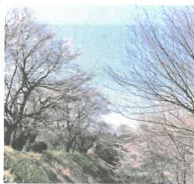
「旧口北小学校と 向泉自治会の桜」