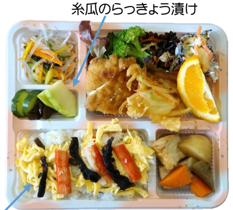
糸瓜のらっきょう漬

スタミナ維持にいいお弁当です。鉄分を多く含むひじきと、鉄分の吸収率を上げる柑橘系の果物、野菜たっぷり消化にもいいです。夏バテ予防にもってこいですね!!