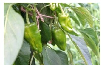
ジャンボピーマン