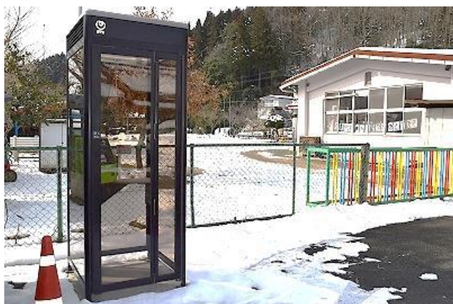
振興センター駐車場 保育所隣に設置

NTT 西日本により、1月末田森自治振興センター駐車場に公衆電話ボックスが設置されました。テレホンカードと硬貨で利用できます。携帯電話の普及により、公衆電話は各地で撤去されてきましたが平成23年の東日本大震災を教訓に、いま避難所を中心に公衆電話の設置が進められています。